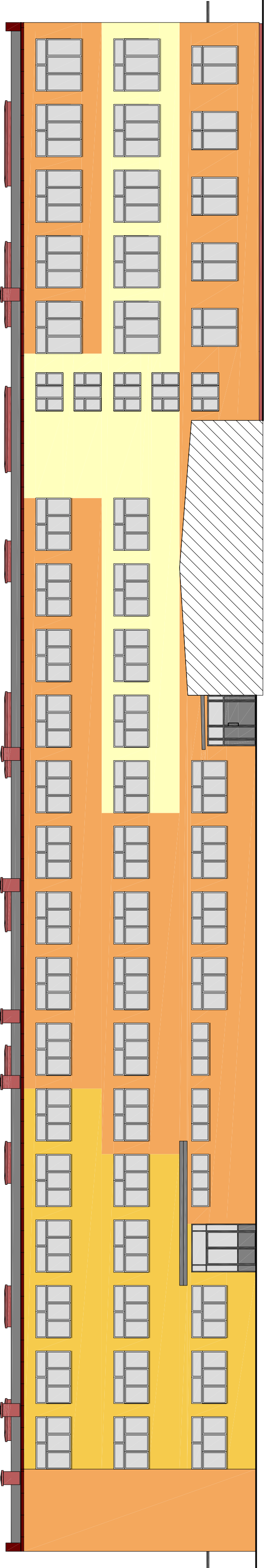
ELEWACJA PÓŁNOCNA (BUDYNEK SZKOŁY)

KOLORYSTYKĘ ELEWACJI WYKONANO NA PODSTAWIE PRZYKŁADOWEJ PALETY BARW WZORNIKA "GREINPLAST" I PALETY "RAL"